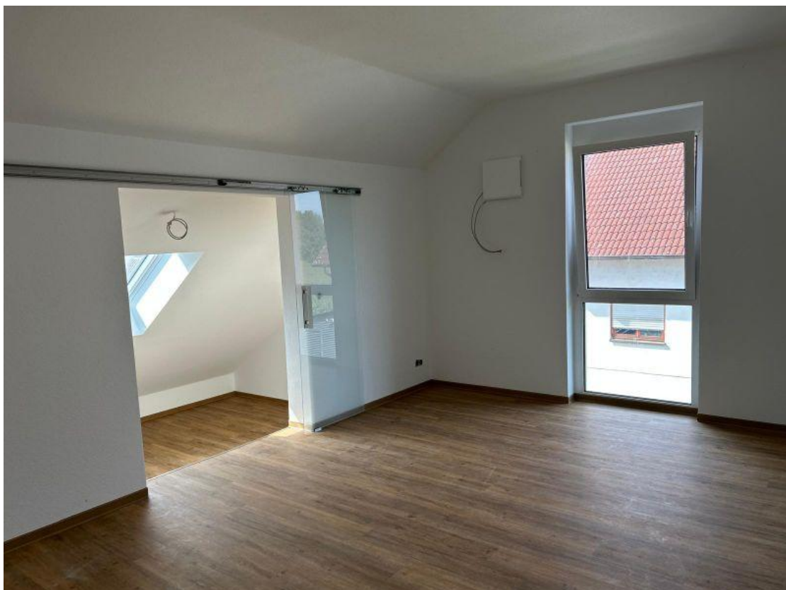
Elternschlafzimmer mit begehbaren Kleiderschrank