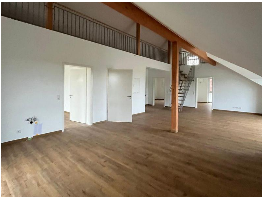
Wohnbereich - Ansicht 3