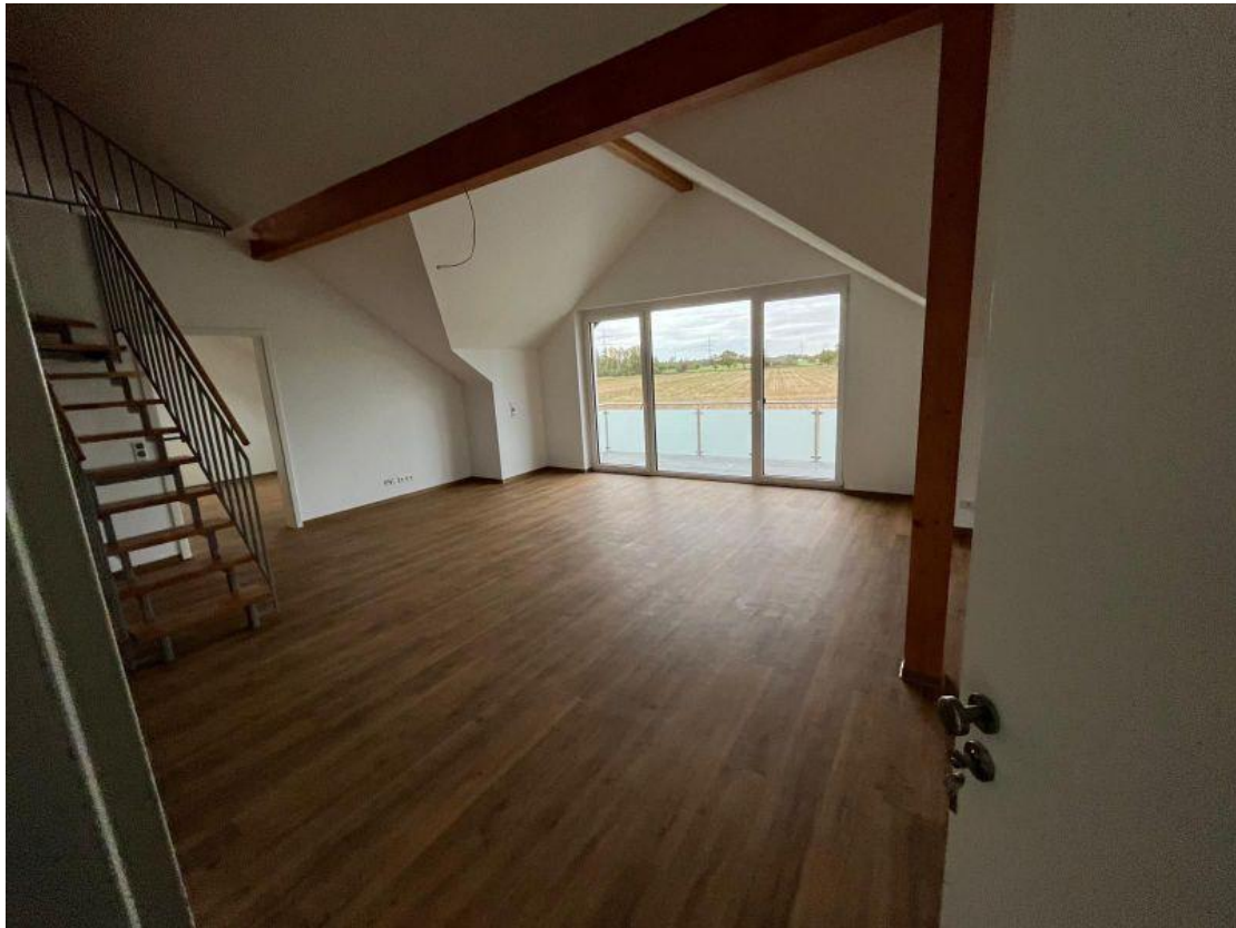
Wohnbereich - Ansicht 2