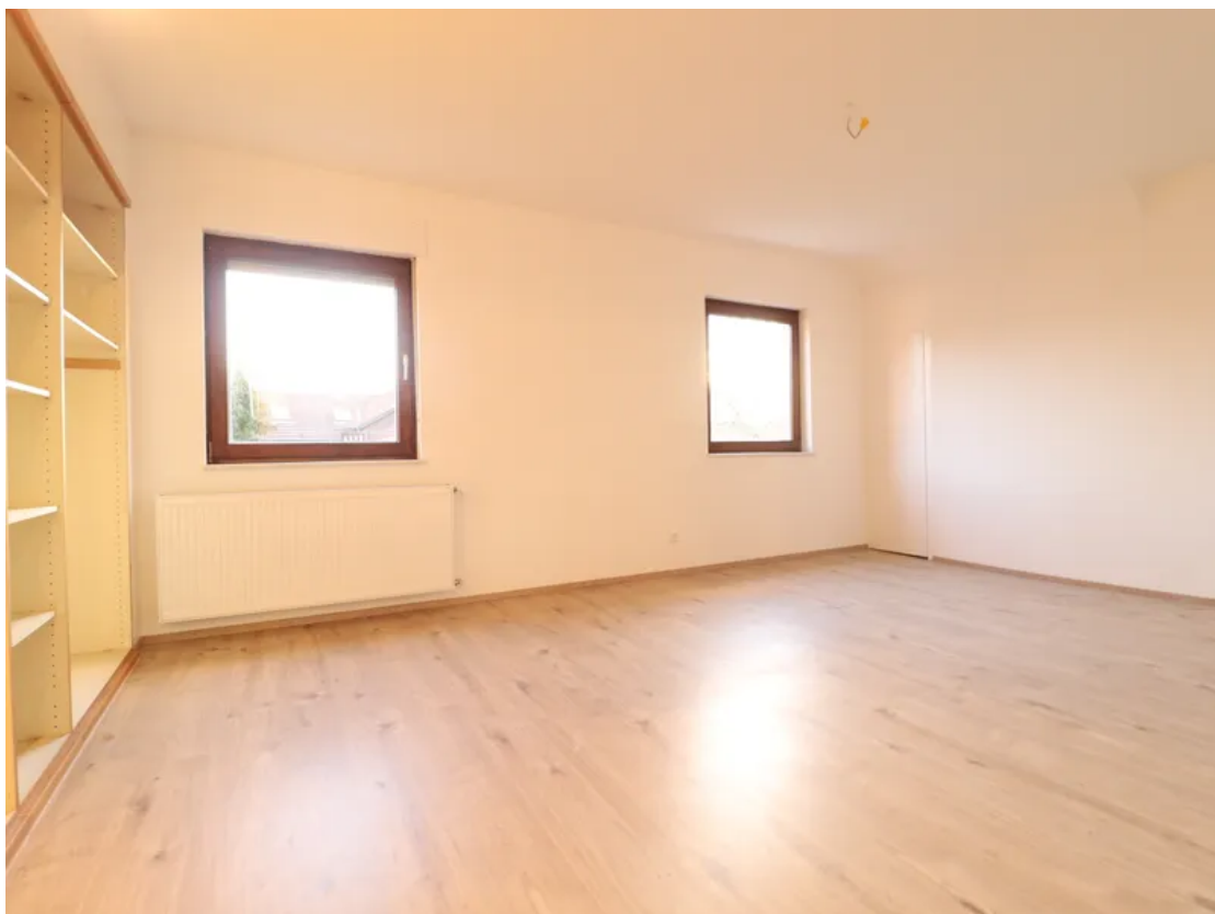
Schlafzimmer - Ansicht 2