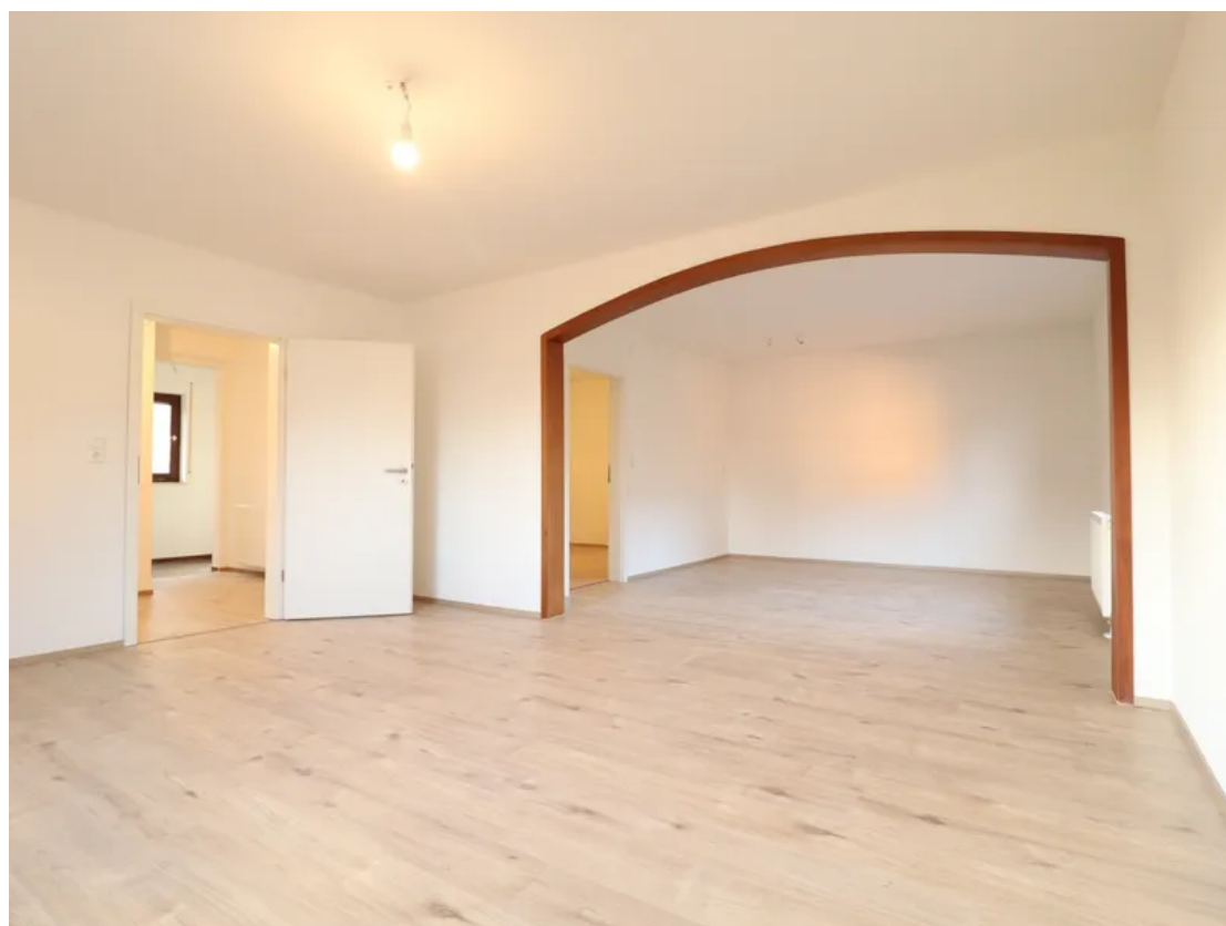
Wohn- & Essbereich - Ansicht 1