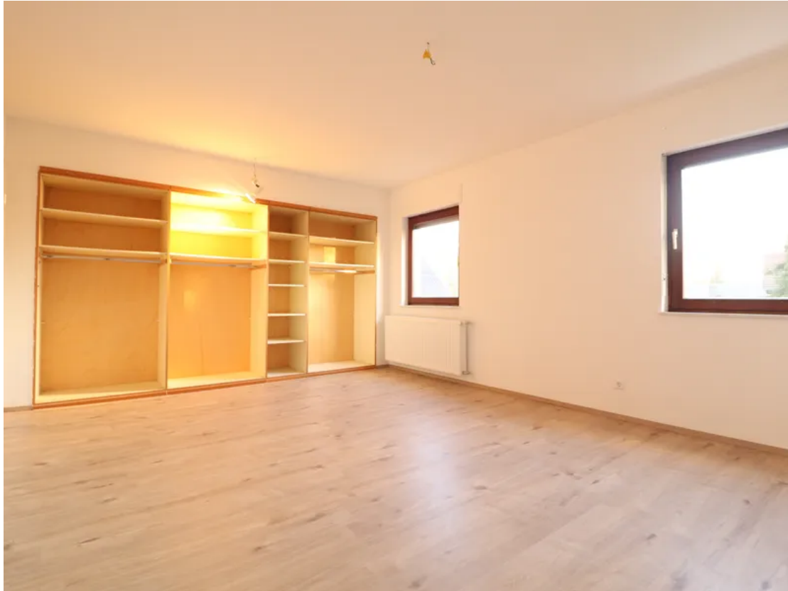
Schlafzimmer - Ansicht 1