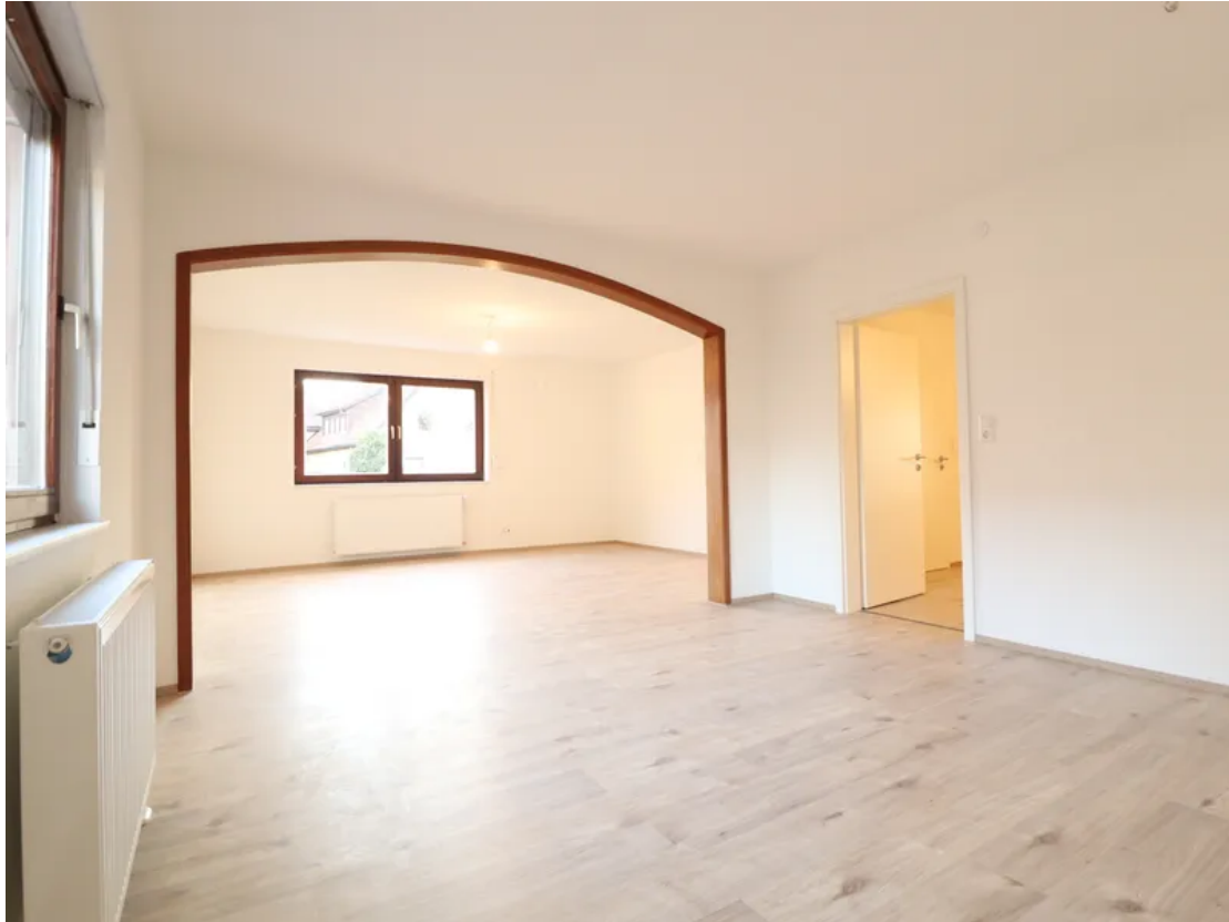
Wohn- & Essbereich - Ansicht 2