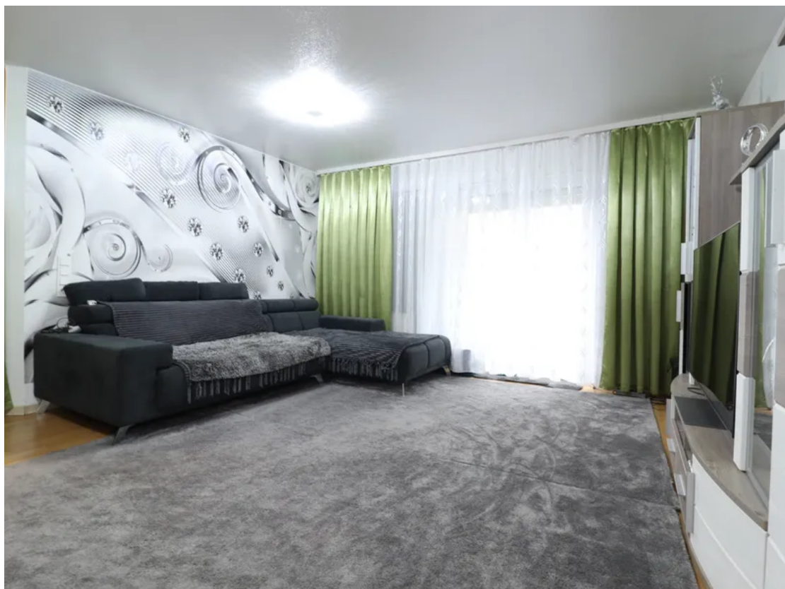
Wohnzimmer - Ansicht 1