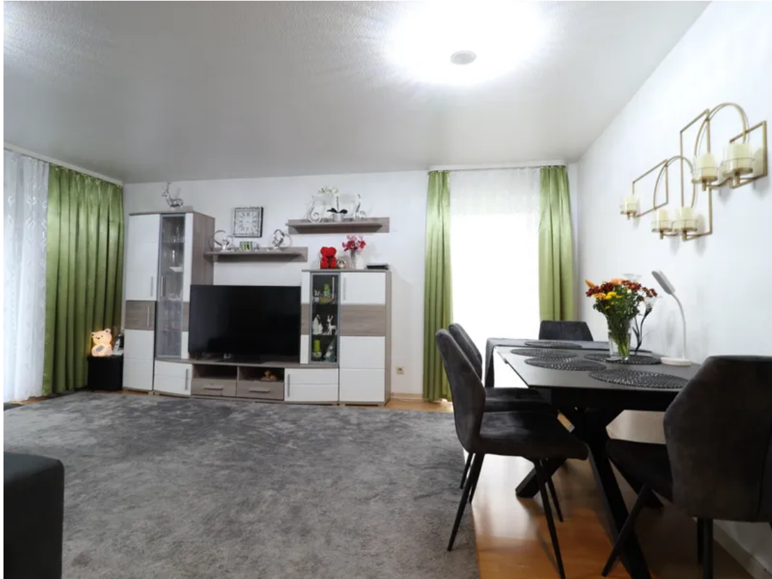
Wohnzimmer - Ansicht 1